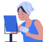
スキンケア Skin Care