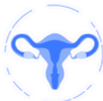
アフターピル After Pill