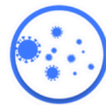
HIV予防 HIV Pre-Exposure Prophylaxis